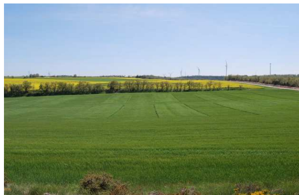
Figura 1. Camp d'assaig de Conill. (Font: DAAM, 2012)

Des de l'any 2008, el DAAM duu a terme un estudi a Conill (Calonge de Segarra) per a conèixer l'eficiència i la capacitat fertilitzant de diferents productes orgànics (purí porcí, gallinassa, fem de conill i fang d'EDAR) en els cultius extensius d'hivern.